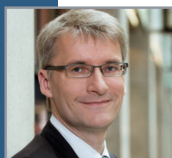
Elmar Theveßen Stv. ZDF-Chefredakteur