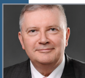
Oswin Veith, MdB Präsident des Verbandes der Reservisten der Deutschen Bundeswehr e. V.