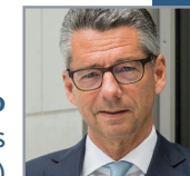
Ulrich Grillo Präsident des Bundesverbandes der Deutschen Industrie e. V. (BDI)