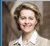
Dr. Ursula von der Leyen, MdB Bundesministerin der Verteidigung