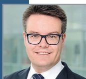
Dr. Tobias Lindner Mitglied des Deutschen Bundestages