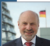
Rainer Arnold Mitglied des Deutschen Bundestages