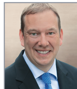
Henning Otte Mitglied des Deutschen Bundestages

„Sicherheit dreidimensional: Diplomatie – Verteidigung – Innere Sicherheit“