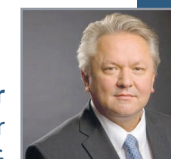
Armin Papperger Vorstandsvorsitzender Rheinmetall AG